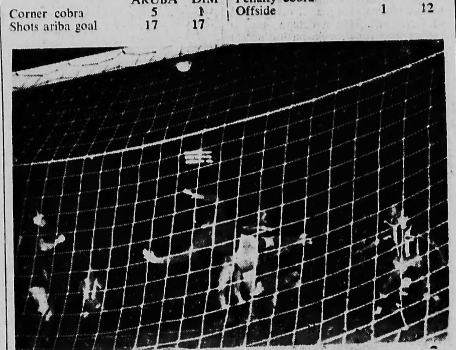
Aruba a hunga mehor den segundo mitar di e match contra DIM y a presenta varios momentonan manera esaki.